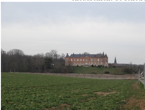
Le château de Louye (voir autre fiche)

Les avis seront cohérents avec ceux émis ces dernières années, à savoir : pas de maisons à volume compliqué (type V, W, Y, ou Z), pentes à 45° pour les volumes principaux, ardoise ou tuile plate de teinte brun vieilli, à 20u/m 2 , avec un débord de toiture de 20cm, enduit de teinte beige clair avec modénatures (au choix : chaînages, encadrement de fenêtres, soubassement, colombage...). *Voir les autres fiches.