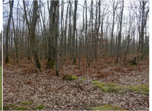
Les bois entourant le château

Pour les zones en bleu dans le périmètre de 500m et au-delà