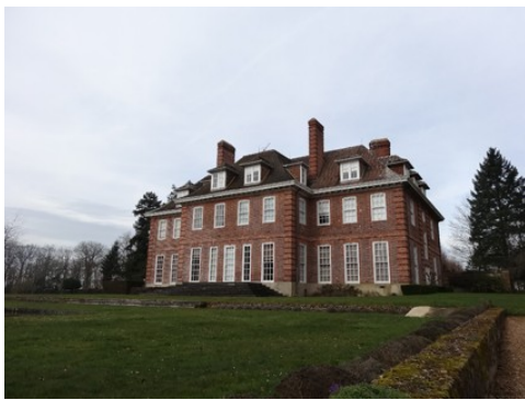
La façade est du château