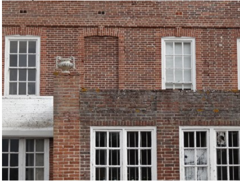
La brique en façade (détail)