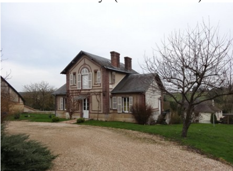
Le bâti rural avoisinant