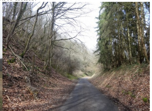
Une route voisine traversant un bois