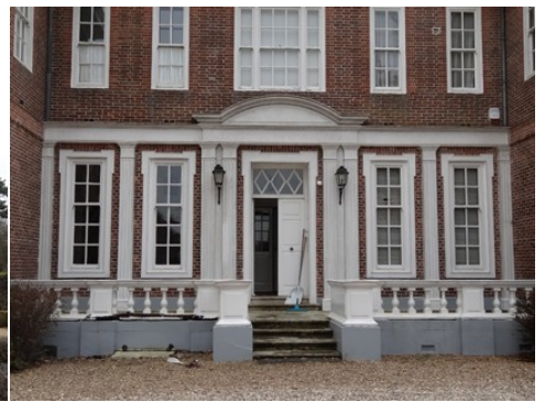
L'entrée et son perron