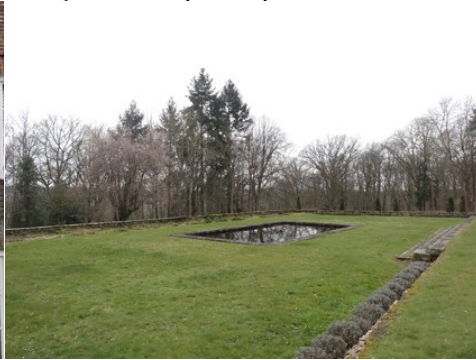
Le parc et les bois alentours