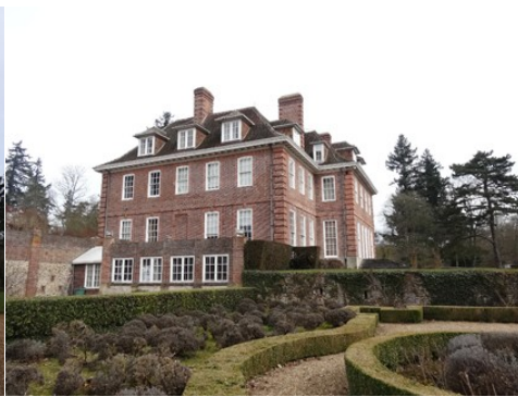
La façade sud depuis le parc