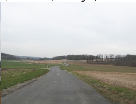
L'alternance de plaines et de bois