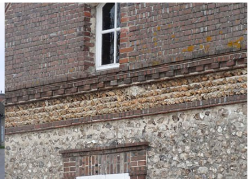
La combinaison des matériaux (détail)